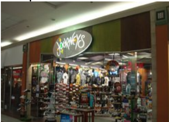
¡Tenemos un poco de todo en Santa Rosa!