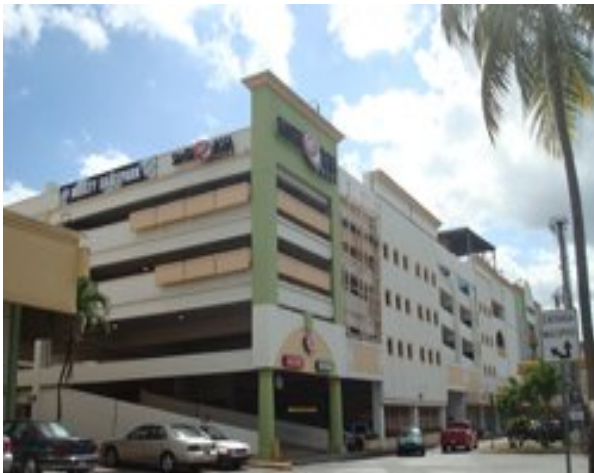
¡Bienvenido a Santa Rosa Mall!