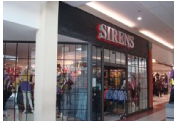
¡Ropa de fashion en Santa Rosa Mall!