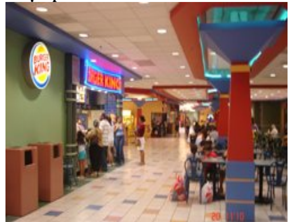
¡Nos veremos en el Food Court!