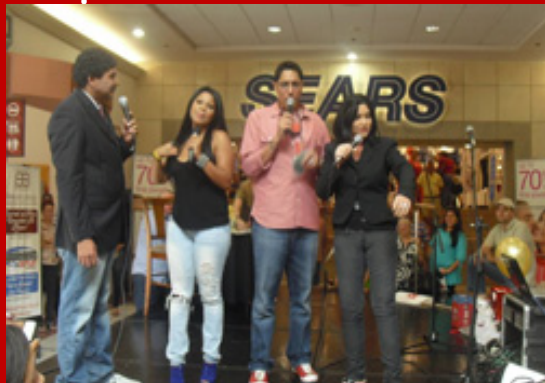
El Enamorado – 14 febrero 2011.