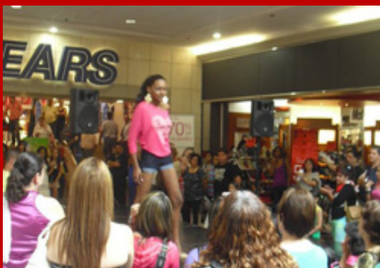
¡Fashion Show Enamorado!